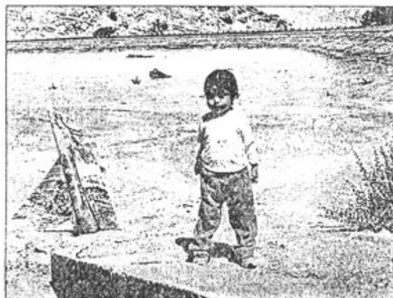
El estanque no ha cumplido con su objetivo y hoy luce sólo como un monumento al plástico, lleno de arena y maleza.